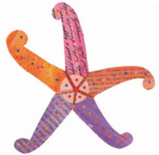
Étoile de mer