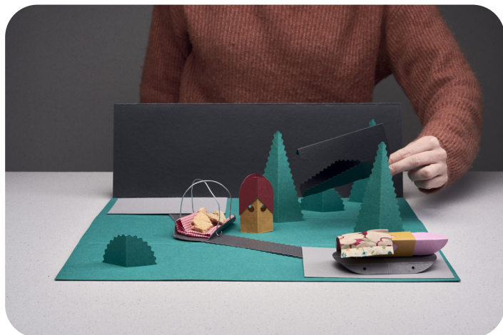
Récit du conte du Petit Chaperon rouge avec des objets symboliques